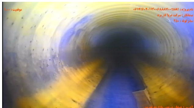
شماره تصویر ۱ موقیعت ۱۰۰۰ کد MH نقطه ی شروع / آدمرو عنوان