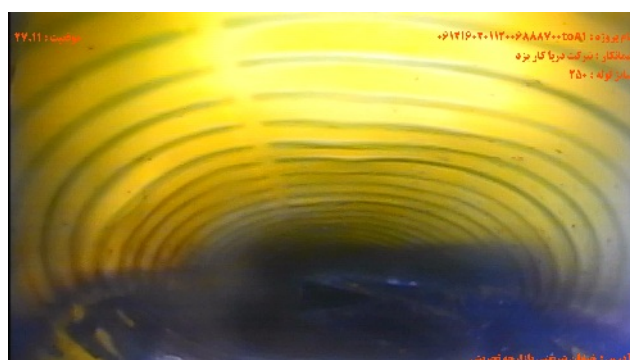
شماره تصویر ۴ موقیعت ۲۷.۱۱ کد D تفسیر شکل / بیضوی شدن / به میزان % درصد ۵۰ عنوان